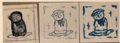
(原画と典具帖ばかし)