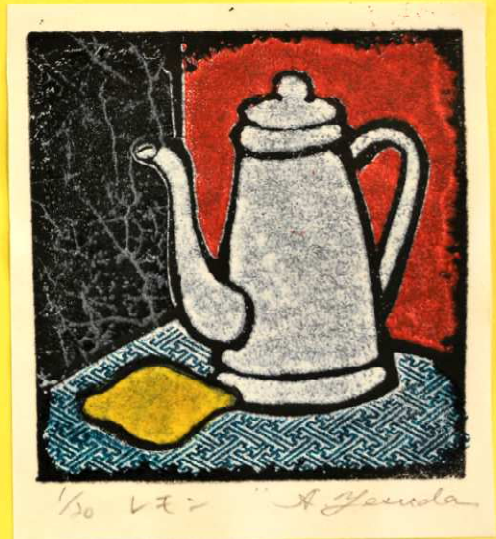
表紙絵 安田 彰