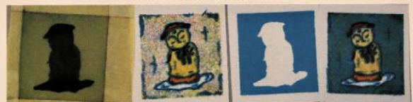
最終仕上げ(背景刷)